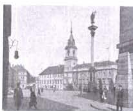
WARSAWA – VARSÓ 1932 évben