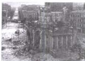
Felkelés után 1944 évben